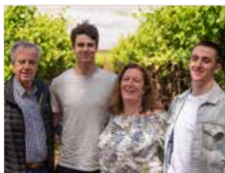
Familie Byrne im Weinberg